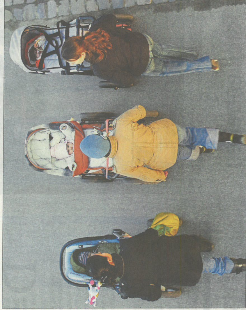
Alleinerzieher und Familien mit Kindern sind in Luxemburg einem hohen Armutsrisiko ausgesetzt. Schuld daran haben nicht zuletzt die hohen Wohnkosten.

Während die Armutsrate seit zwei Jahren auf einem historisch hohen Niveau stagniert, geht die Schere zwischen Arm und Reich